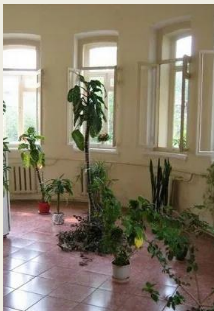
Бывшая операционная Беловолжской больницы